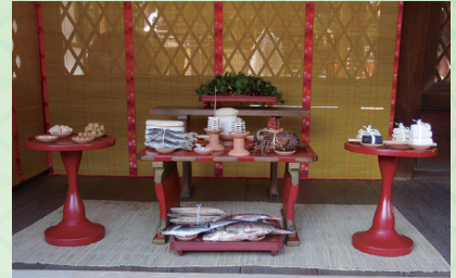
「平安時代の食事の手がかりとなる神饌」

紫式部が『源氏物語』『紫式部日記』を著した時代は、豪華絢爛な宮廷文化が花開いていた。独特の美的センスで調えられた装束、豊富な食材が工夫を凝らして調理された食事など、平安時代の暮らしを紐解く。