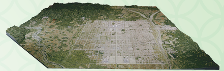
「平安京復元模型」 （京都市平安京創生館展示、京都市歴史資料館蔵）

平安京は、古代律令国家の到達点ともいえる都市計画をもった「みやこ（都）」でした。本企画展示は、飛鳥の宮殿から平安京に至る、およそ200年間の都の変遷と都市計画の歴史を考えます。