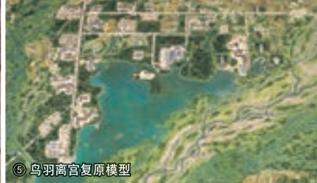
⑤ 鸟羽离宫复原模型