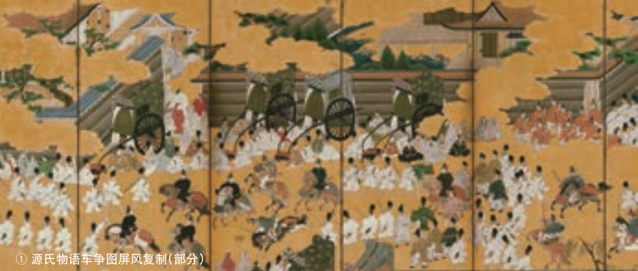
① 源氏物语车争图屏风复制(部分)