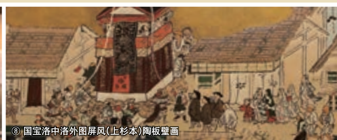
⑧ 国宝洛中洛外图屏风(上杉本)陶板壁画