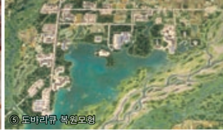
⑤ 도바리큐 복원모형