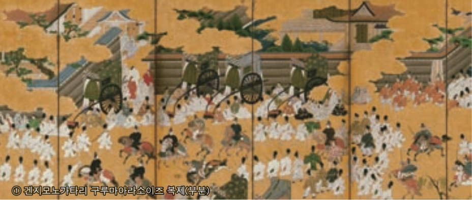
① 겐지모노가타리 구루마야라소이즈 복제(부분)