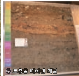
⑦ 토층을 떼어낸 패널