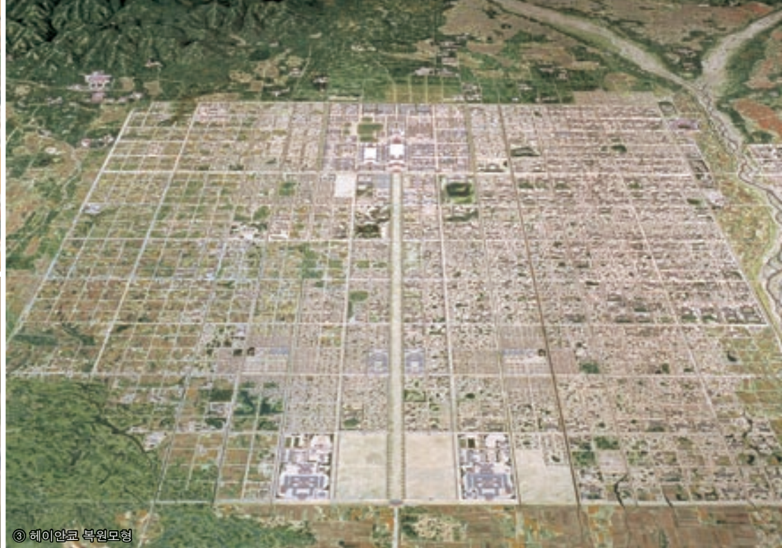
③ 헤이안쿄 복원모형