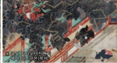
④ 국보 기타노텐진엔기 에마키(조큐본)복제