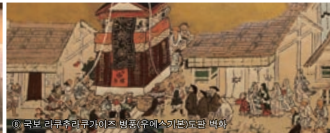
⑧ 국보 라쿠추라쿠가이즈 병풍(우에스기본)도판 벽화