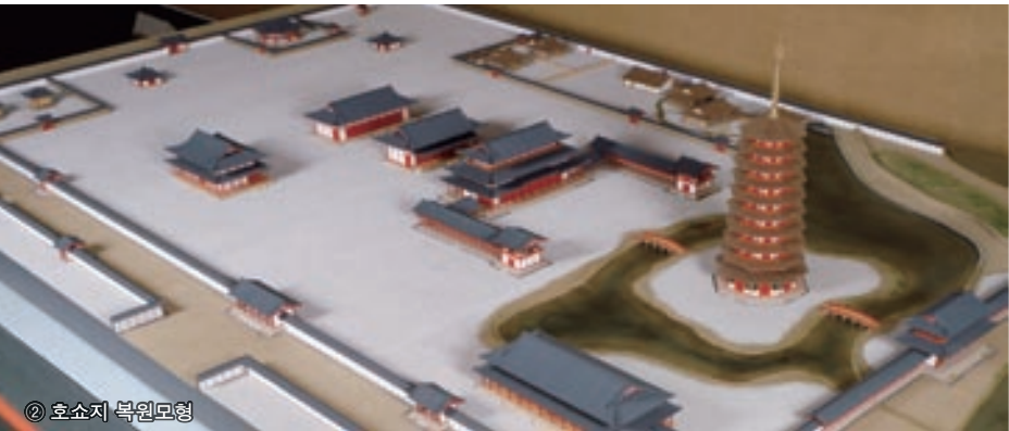
② 호쇼지 복원모형