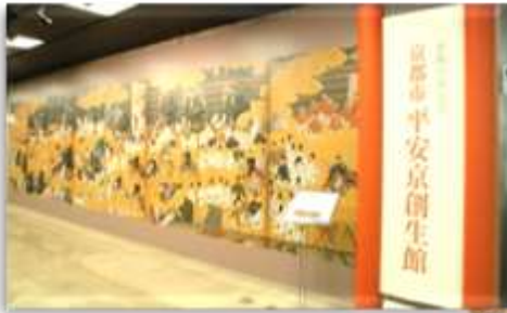
京都市平安京創生館入り口

また、半年ごとに、様々なテーマを取り上げて企画展示を開催しています。充実した学習資料で、平安京を間近に体感し、学ぶことのできる施設です。